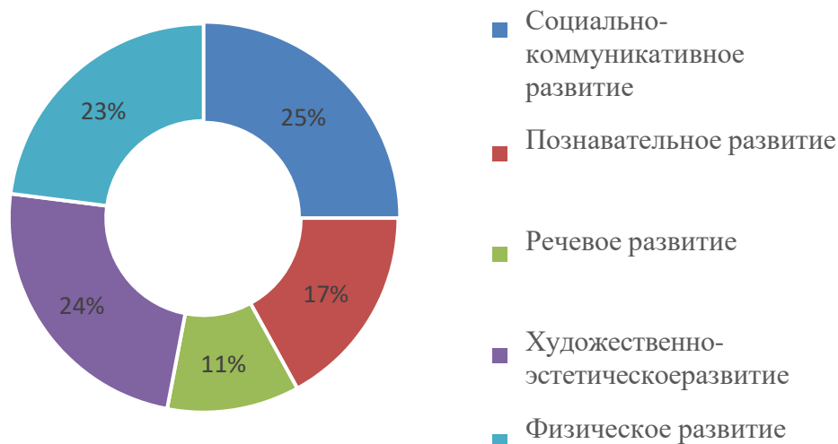
Рисунок 2. Рейтинг интересов родителей(законных представителей)

Однако отмечается низкий уровень заинтересованности в вопросах познавательного и особенно речевого развития детей. Поэтому в Программе должны быть отражены те формы работы с семьями воспитанников, которые предполагают активное вовлечение родителей (законных представителей) в образовательный процесс (совместная работа над детскими проектами, создание мини-книжек с рассказами детей, изготовление совместных поделок с детьми и пр.). (Рис. 2)